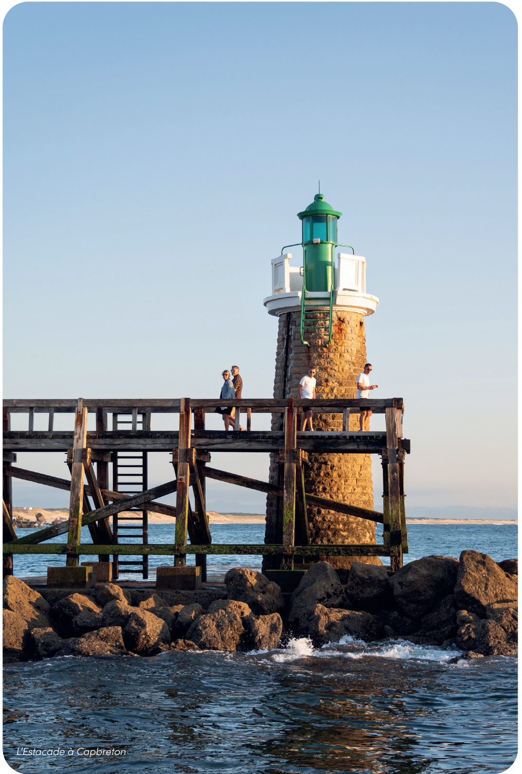
L'Estacade à Capbreton